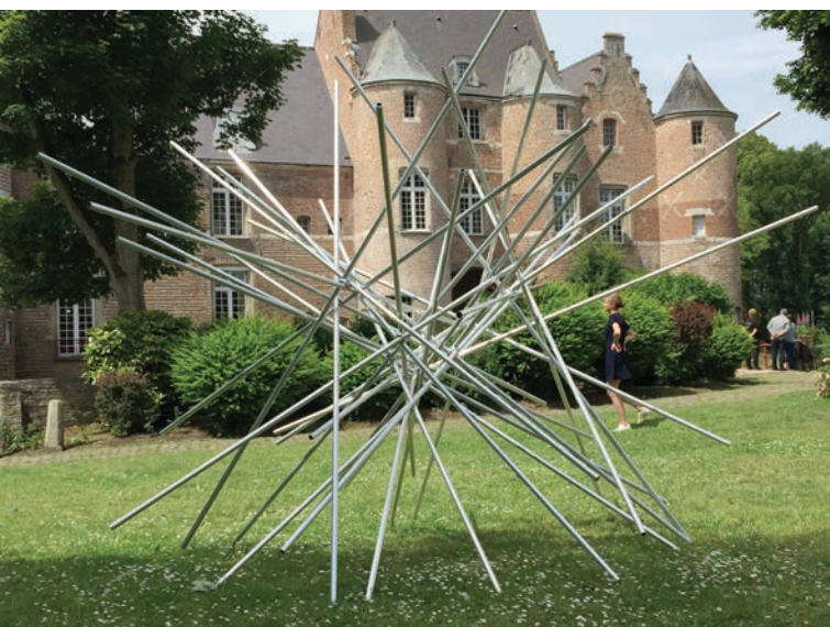
Image Object Tuesday 21 January 2015 4:37pm

Artie Vierkant, Image Object Tuesday 21 April 2015 4:39pm et